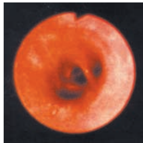
Esta foto muestra una vía respiratoria saludable (parte superior) y una vía inflamada (parte inferior) en el pulmón. El ozono puede inflamar el revestimiento del pulmón, y episodios repetidos de inflamación pueden causar cambios permanentes en el pulmón.