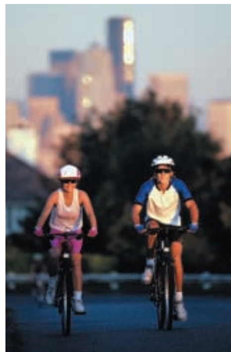
Usted puede ayudar a reducir los niveles de ozono caminando, usando bicicletas, compartiendo el automóvil, o utilizando el transporte público como una alternativa a conducir un automóvil.

Para más ideas sobre lo que usted puede hacer, visite el sitio de la EPA en la red mundial en http://www.epa.gov/airnow/consumer.html .